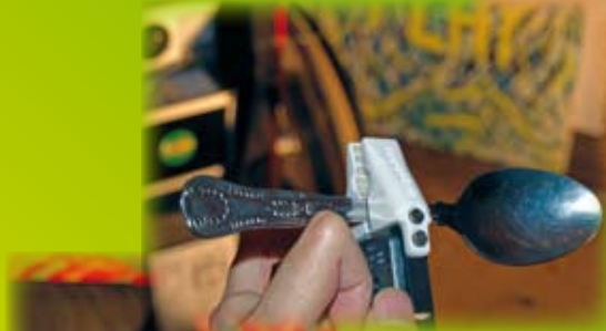
Löffel, Stift oder Glas sicher und stabil halten