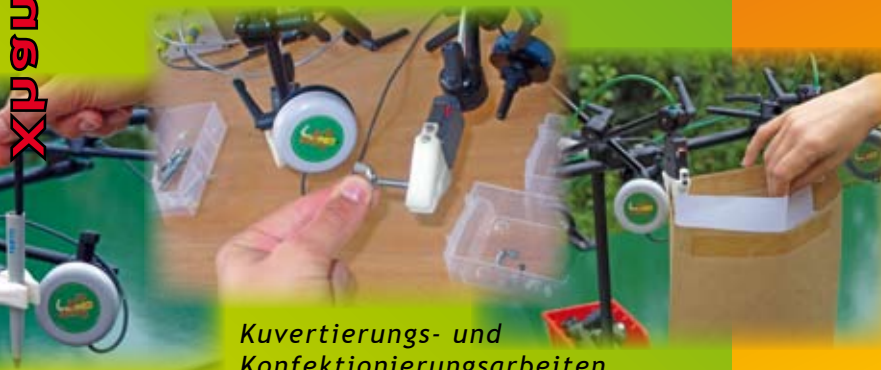
Kuvertierungs- und Konfektionierungsarbeiten